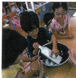
(泡あそび・せっけんあそび)