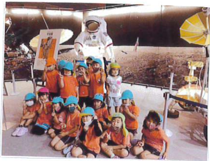
宇宙展に 行きました

引き続き、感染予防対策に気をつけながら、子供たちと楽しく過ごしていきたいと思 います。