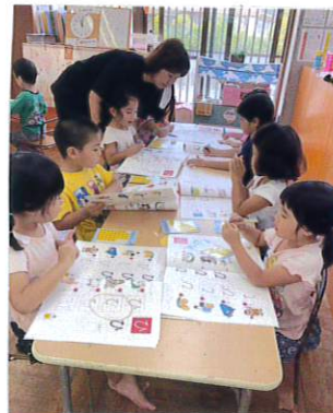
カンガルー勉強も 頑張っています