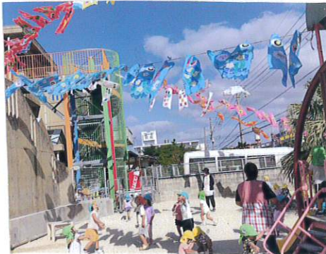
さくら組は みずいろの こいのぼりです