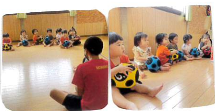
〈けん先生の話に集中して聞く〉 子どもたち♡

体育指導も始まり、けん先生と新しいことに挑戦することぞ 子どもたちも目をキラキラ輝かせて参加しています まだ慣れず泣いてしまう子もいますが、ゆくり楽しんでいけたらと思います!