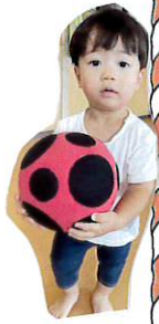
〈片付けもしっかり頑張っています!〉