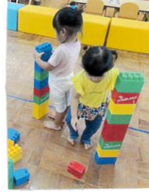
「ハロウィン」ハズル できたよ! 「ブロック」 いっぱい! (大型ブロック 高く積みだしたよ)

一段目が暮れるのが早くなり秋を感じる季節となりました!! 日中は涼しくなり 戸外あそびや散歩を楽しんでいます。季節の変わり目 体調を崩しやすいですが一人ひとりの体調の変化に気をつけて、元気に 過ごせるようにしていきたいと思ひます。 できた!! ~ 鉄棒ぶらんぶらん