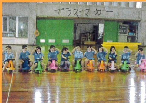
プラスチックカー