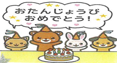
フルシマ ヨシュア れおくん