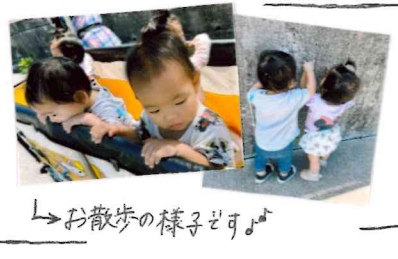
お散歩の様子です♪

梅雨の蒸し暑さで体調を崩さないように、こまめに水分補給をしながら、健康には十分に気を付けて元気いっぱい過ごせるよう配慮していきます。雨の日が続くこともあります、楽しめるように工夫しながら活動していきたいと思っています。