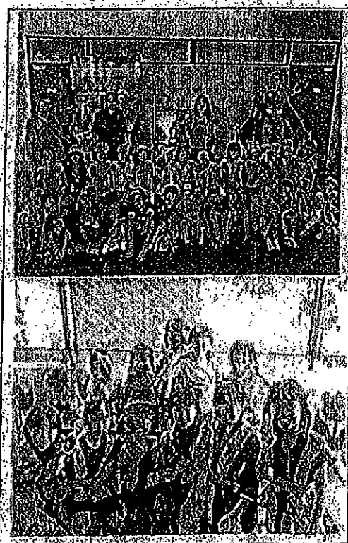
(夏休み期間、色々な体験・見学しました。)